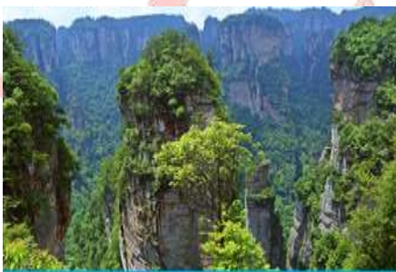
ภูเขาฮาดีลุยา

ไปหลงเพื่อโดยสารลิฟท์แก้วชมวิวดูไฮเทคจากสถานีที่อยู่ตีนเขาขึ้นสู่สถานีที่อยู่บนยอดเขาจักรพรรดิ หรือ เขาเทียนจื่อซาน(เขาวตาร) ลิฟท์แก้วไปหลง เป็นลิฟท์แก้วชมวิวดูสองชั้นแห่งแรกในทวีปเอเชียที่สร้างขึ้น เลียนหน้าผาสูงชัน มีความสูง 326 เมตร ขณะโดยสารในลิฟท์แก้ว ท่านจะได้ตื่นตาตื่นใจกับ ยอดเขาฮาดีลุยา มี ความสูงถึง 1,250 เมตร ชมทิวทัศน์อันสวยงามที่สุดแสนประทับใจของ อุทยานจางเจียเจีย ทั้งด้านทิศ ตะวันออก ทิศใต้และทิศตะวันตกของเขเทียนจื่อซานเต็มไปด้วยชะง่อนผาอันสูงชัน เหวลึก และป่าหินยักษ์ ในรูปลักษณะต่างๆ ยืนตระหง่านค้ำฟ้า ชม เทียนเสี่ยวตี้เอี๋เอียวสะพานหนึ่งในใต้หล้า (สะพานใต้ฟ้าอันดับ 1) ใน อุทยานจางเจียเจีย ปติมากรรมทางธรรมชาติที่น่าอัศจรรย์หมู่จุนเขาหินประหลาดนับพันได้กลายเป็นฉากถ่าย ทำหนัง “อวตาร” ภาพยนตร์ฮอลลีวู้ดชื่อดัง ท่านจะได้เพลิดเพลินกับทิวทัศน์อันสวยงามที่แสนประทับใจไม่รู้ ลืม และยากที่จะหาคำบรรยายได้