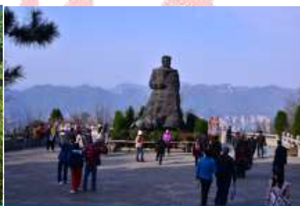
สวนจอมพลเอ๋อหลง