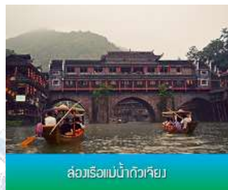
ล่องเรือแม่น้ำถั่วเจียง

หลังอาหารนำคณะเที่ยวชมเมืองฟงหวง เมืองโบราณฟงหวง เมืองเก่าแก่อายุหลายร้อยปี ชมเมืองที่สร้างขึ้นสมัยราชวงศ์ถัง เดิมมีชื่อว่า “หวงซือเฉียวกู่เจิง” กำแพงโบราณ และบ้านเรือนโบราณที่มีเอกลักษณ์เฉพาะของเมืองสร้างความโดดเด่นให้ที่นี่ บ้านเรือนโบราณในอดีตกาลบางส่วนถูกตัดแปลงเป็นร้านค้าและร้านจำหน่ายสินค้าที่ระลึกในปัจจุบัน ชมจัตุรัสหงส์ ที่มีรูปนกหงส์จำลองที่ทำจากทองเหลือง อันเป็นสัญลักษณ์ที่โดดเด่นของเมืองโบราณแห่งนี้...ชม สะพานหงเจียว สะพานไม้โบราณที่มีหลังคาคลุมเหมือนสะพานข้ามคลองในเวนิส สะพานแห่งนี้เคยเป็นด่านเก็บภาษีเกลือในสมัยราชวงศ์ชิง ซึ่งยังคงรักษารูปทรงในอดีตไม่เปลี่ยนแปลง.....เมื่อเสร็จจากการเที่ยวชมเมือง นำคณะเดินทางเข้าที่พักที่อยู่ไม่ไกลจากเมืองโบราณ