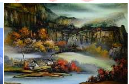
พิพิธภัณฑ์ภาพหิ้งกราย

**หมายเหตุ : ในฤดูท่องเที่ยวที่มีจำนวนนักท่องเที่ยวต่อแถวขึ้นกระเช้าเป็นจำนวนมาก ทางบริษัทฯ อาจทำการสลับโปรแกรมให้คณะนั่งรถอุทยานขึ้นไปยังบริเวณถ้ำประตูสวรรค์ จากนั้นนำคณะขึ้นยอดเขาผ่านบันไดเลื่อนทะเลภูเขา เมื่อเสร็จจากการเที่ยวชมบนยอดเขาแล้วจึงนำคณะลงจากยอดเขาโดยกระเช้าลอยฟ้า ซึ่งเป็นการสลับการใช้ยานพาหนะในการขึ้น/ลงเขา เพื่อหลีกเลี่ยงการรอคิวที่นานเกินไปในช่วงเทศกาล*****