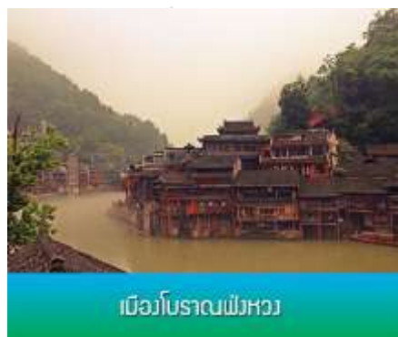
เมืองโบราณฟงหวง

ถึงฟงหวง นำท่านนั่งเรือพายล่องแม่น้ำถั่วเจียง ชมบ้านเรือนโบราณห้อยยาสองฝั่งแม่น้ำถั่วเจียงอันเป็นเอกลักษณ์ของเมืองโบราณแห่งนี้ สัมผัสวิถีชีวิตที่ของชนเผ่าพื้นเมืองที่อาศัยอยู่บริเวณชุมชนนี้มาช้านาน เช่น ชาวบ้านที่อาบน้ำ ซักผ้า หรือล้างผักอยู่ริมฝั่งแม่น้ำ บางครั้งท่านอาจได้เห็นชาวบ้านพายเรือไปร้องเพลงพื้นเมืองไป ช่างเป็นบรรยากาศที่สร้างมนต์เสน่ห์ดึงดูดผู้มาเยือนสำหรับชุมชนชลบทแห่งนี้ทีเดียว...เมื่อเสร็จจากการล่องเรือ