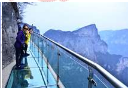
ก้าวเดินกระจกใสวางเวียเจีย