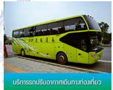
บริการรถปรับอากาศเดินทางท่องเที่ยว

หลังอาหาร นำคณะเดินทางสู่ เมืองฉงเหริน ตั้งอยู่ทางภาค ตะวันออกเฉียงเหนือของมณฑลกุ้ยโจว เมืองชายแดนบนที่ราบสูงขุน นาน กุ้ยโจว พื้นที่ส่วนใหญ่เป็นภูเขาสลับกับเนินเขาประชากรส่วน ใหญ่เป็นชนกลุ่มน้อย อาทิ ชนเผ่าถู่เจีย ชนเผ่าแม้ว และชนเผ่าตัง(ทาง ค่วนใช้เวลา 4 ชั่วโมง)